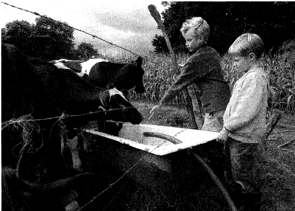
Kinderen beleven vaak veel plezier aan een bezoek aan de boerderij.